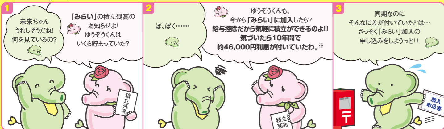
※月掛金は下表で確認してね。